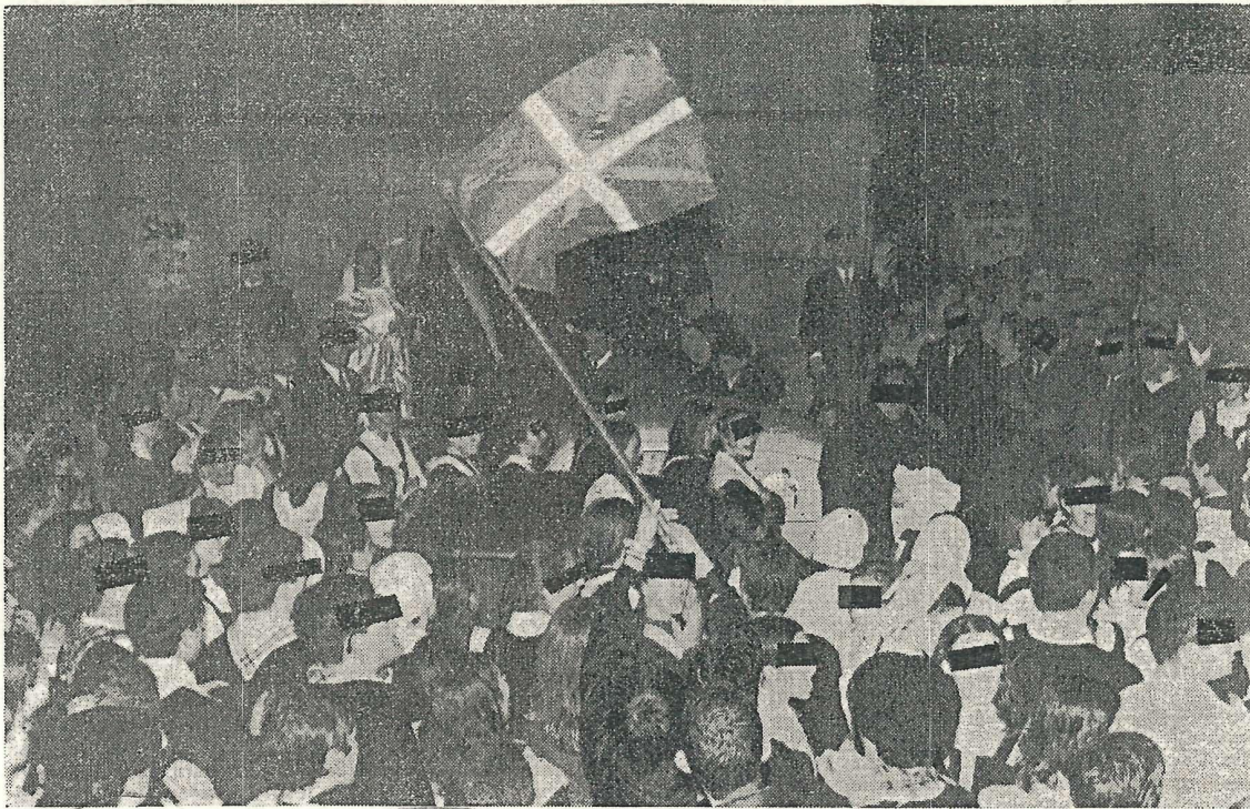
Donosti: Día de Gabón 1967, la juventud se manifiesta.