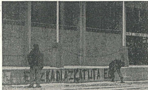
Pamplona: "Breada" de EGI en el campo del Osasuna.