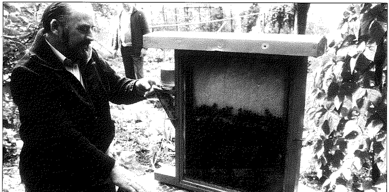
La apicultura española representa casi el 25% del total comunitario

El PE ha instado asimismo al Consejo a establecer una prima de polinización comunitaria por colmena que se conceda por motivos ecológicos y socioeconómicos y a adoptar otras medidas económicas, todo ello a fin de conservar los suficientes enjambres de abejas para asegurar la polinización de la flora. Las 200.000 abejas por kilómetro cuadrado que existen en Europa efectúan el 90% de la actividad polinizadora en unas 80.000 especies vegetales. Si no hubieran abejas en muy poco tiempo desaparecería una cuarta parte de la flora.